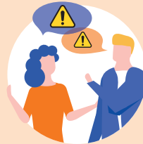
Familien- und Freundeskreis, Nachbarschaft